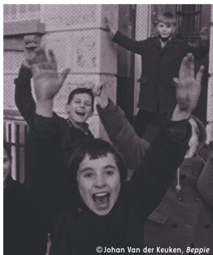
© Johan Van der Keuken, Beppie

Un programme de deux séances d'1h30. À 14h puis à 15h30. À partir de 10 ans.