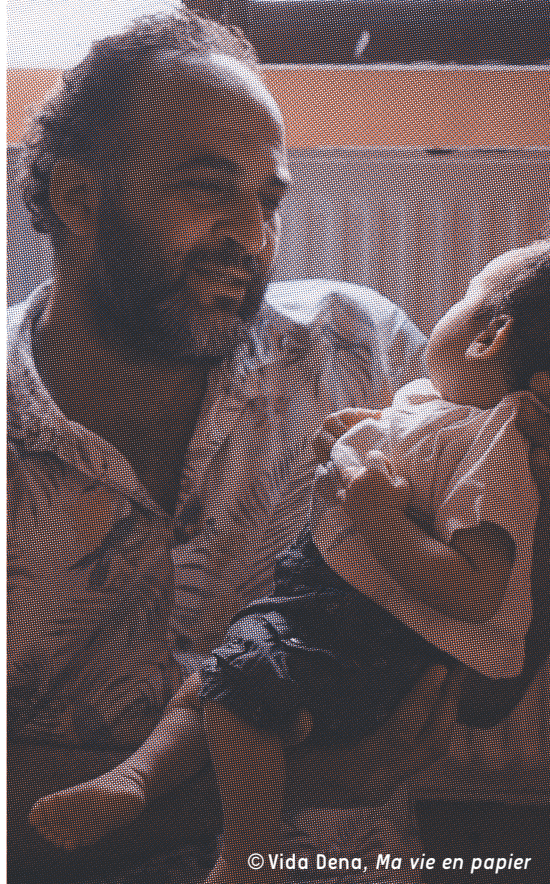
© Vida Dena, Ma vie en papier