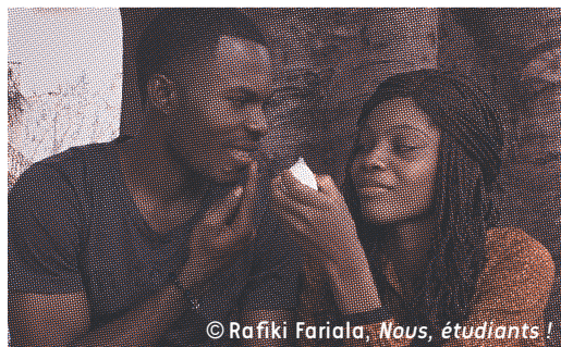
© Rafiki Fariala, Nous, étudiants !

** Xavier Sirven, monteur du film (sous réserve)