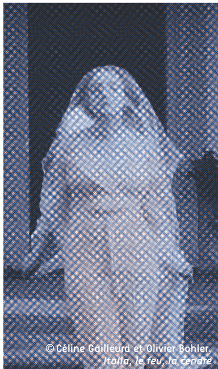
© Céline Gailleurd et Olivier Bohler, Italia, le feu, la cendre